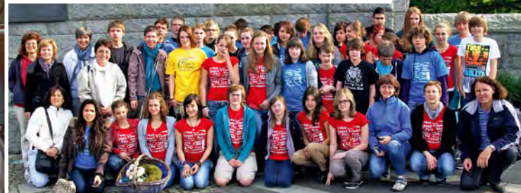
Rencontre sportive à Lay