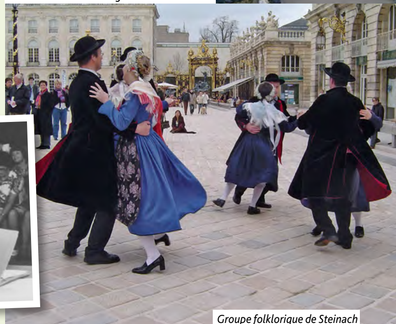
Groupe folklorique de Steinach