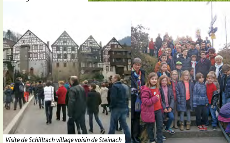
Visite de Schilltach village voisin de Steinach