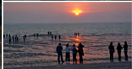
Ados français et allemands sur les plages du Débarquement