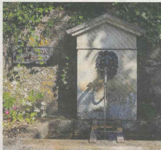
Les plus anciennes fontaines datent de la fin du XIX e siècle.