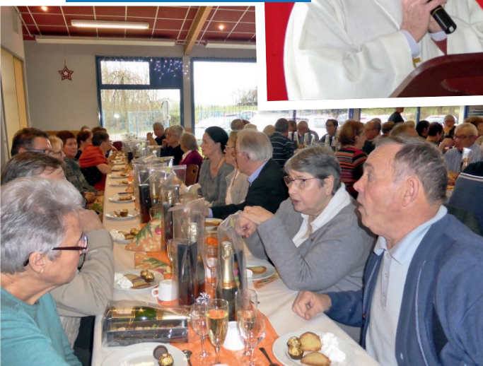
Un sourire au photographe, des douceurs à déguster, un cadeau à emporter et après on danse !