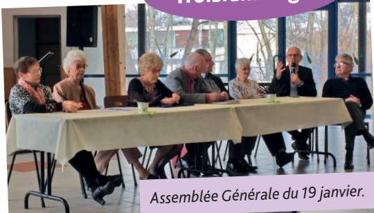
Assemblée Générale du 19 janvier.