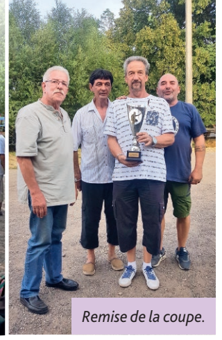
Remise de la coupe.