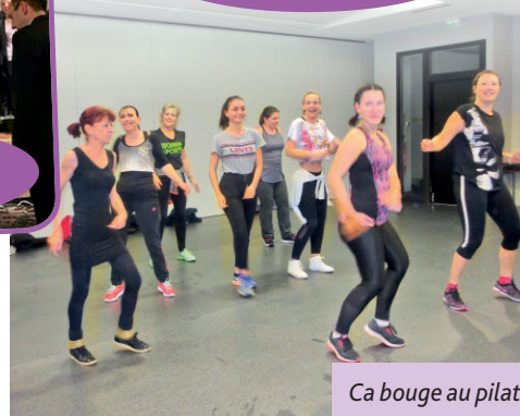
Ca bouge au pilate.