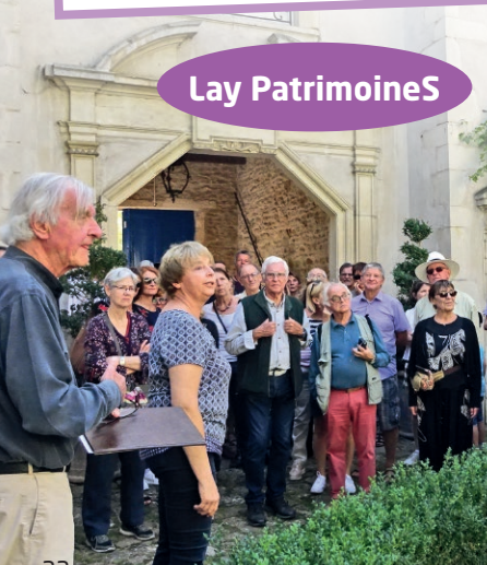
Visite de la Samaritaine.