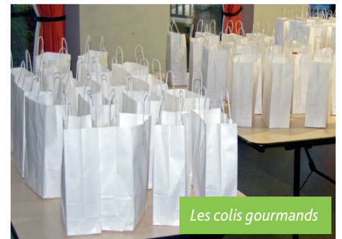
Les colis gourmands