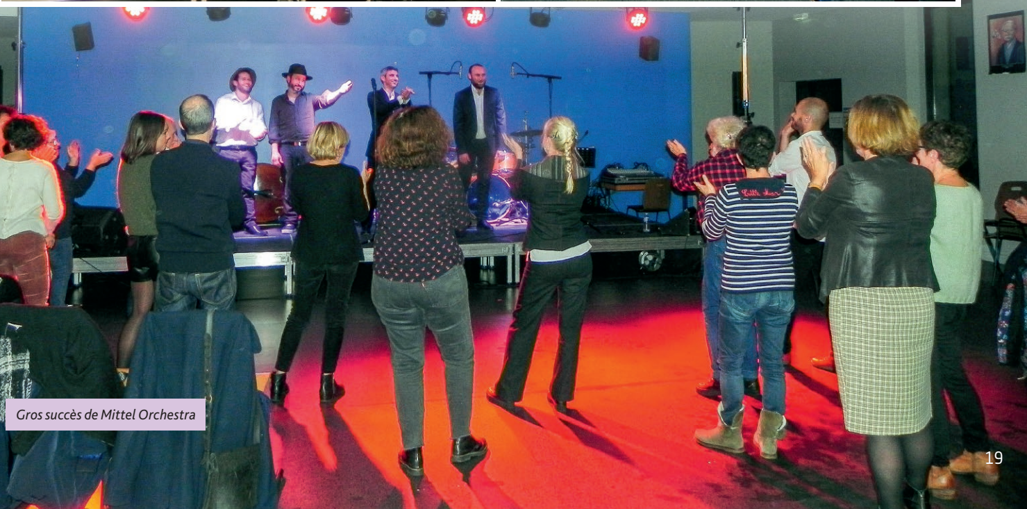
Gros succès de Mittel Orchestra