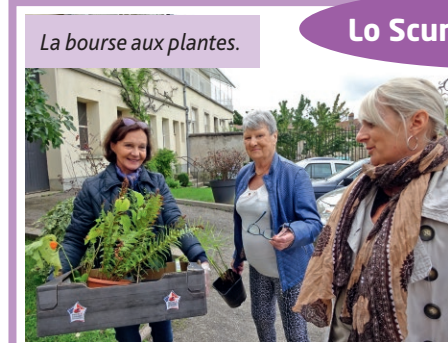
La bourse aux plantes.