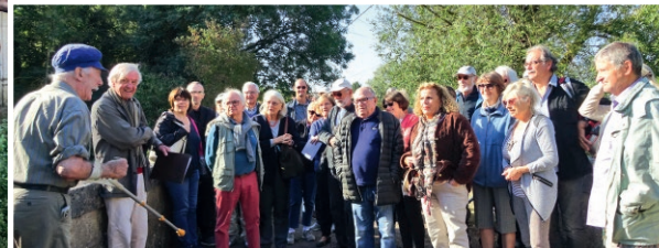
Visite du Moulin Noir.