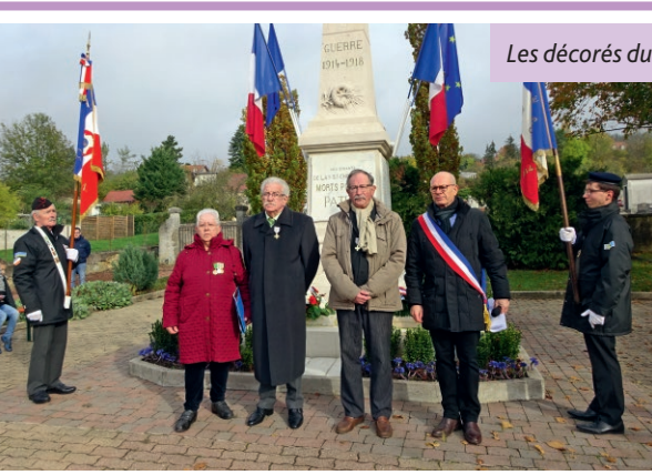
Les décorés du 11 novembre 2019.