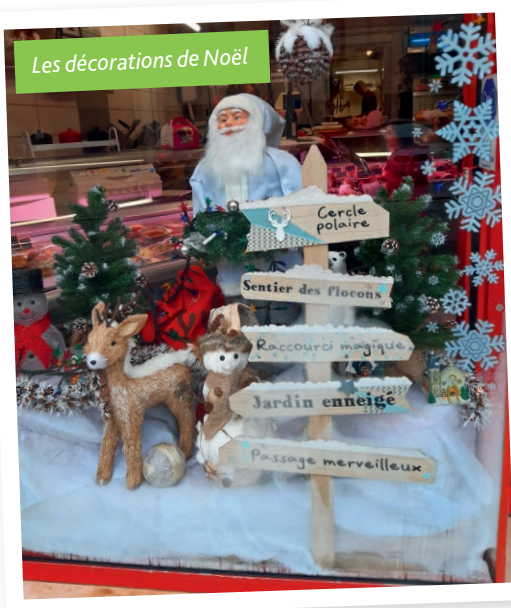
Les décorations de Noël

La remise des prix des maisons fleuries et des décorations de Noël a été l'occasion de dire merci à tous les habitants qui participent activement à l'embellissement de notre village.