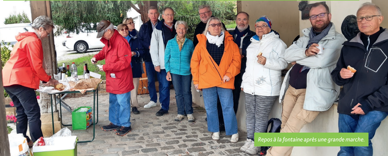
Repos à la fontaine après une grande marche.