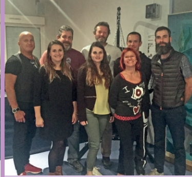
Le bureau de l'association au complet.