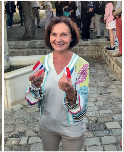
Après les discours officiels, le ruban est coupé et... avant de prendre le verre de l'amitié, chacun a pu apprécier les chants de la chorale Alaygro qui a animé cette cérémonie.