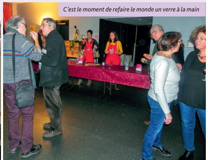
C'est le moment de refaire le monde un verre à la main