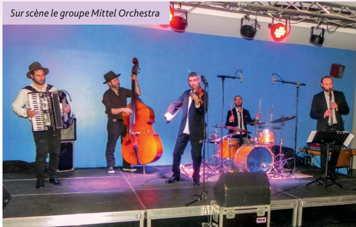
Sur scène le groupe Mittel Orchestra