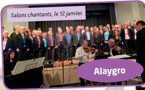
Salons chantants, le 12 janvier.