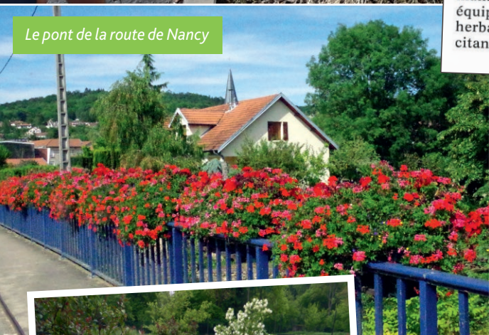
Le pont de la route de Nancy

L'objectif a été atteint. Pascal et Philippe ont eu le plaisir de voir leur travail récompensé en accrochant les nouveaux panneaux aux entrées du village.