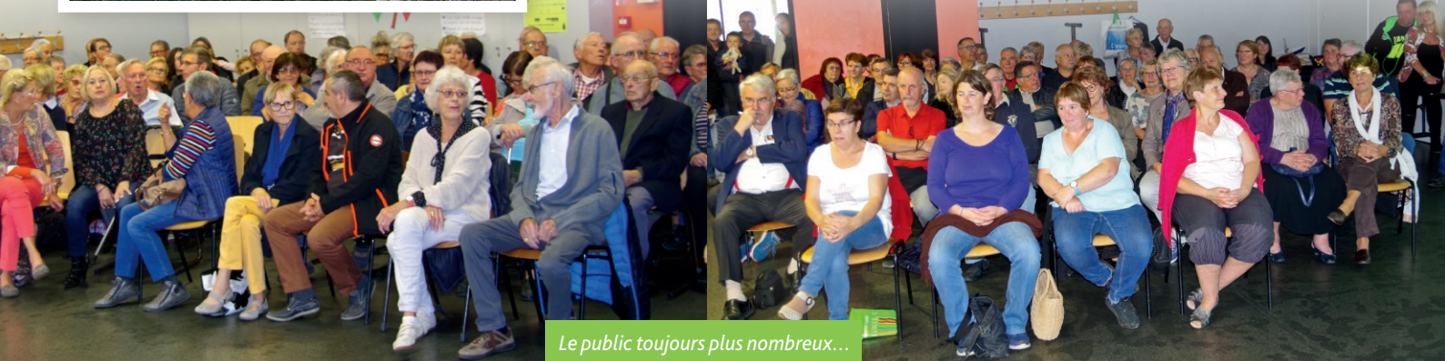
Le public toujours plus nombreux...