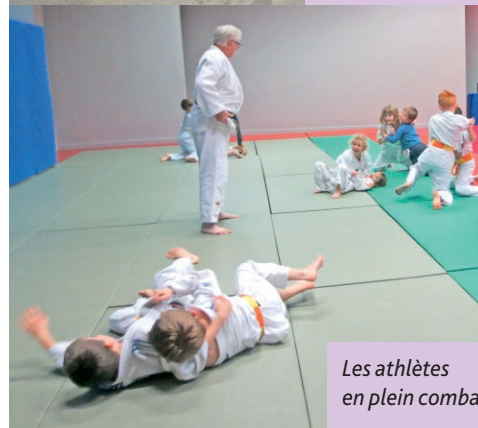
Les athlètes en plein combat.