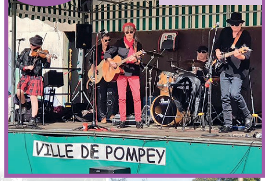
Potofeu à Celtinlor.