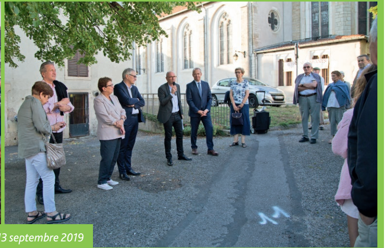
L'inauguration le 13 septembre 2019