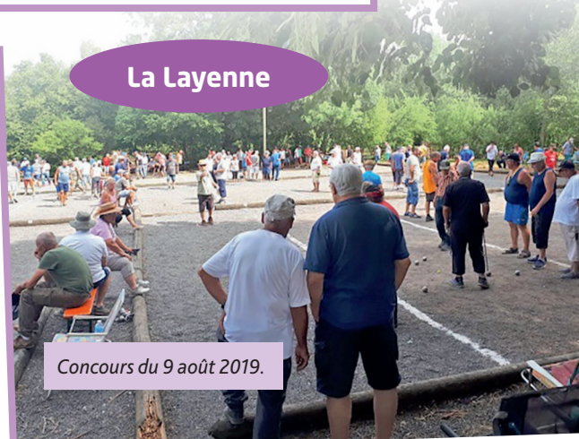
Concours du 9 août 2019.