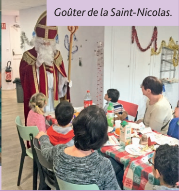
Goûter de la Saint-Nicolas.