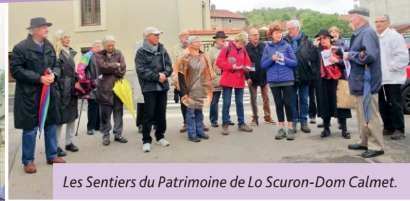
Les Sentiers du Patrimoine de Lo Scuron-Dom Calmet.