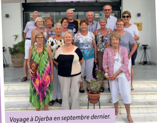
Voyage à Djerba en septembre dernier.