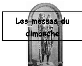
Les messes du dimanche